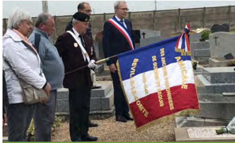
Cérémonie patriotique / 8 Mai