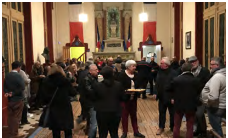
Voeux aux acteurs de notre village / 16 janvier