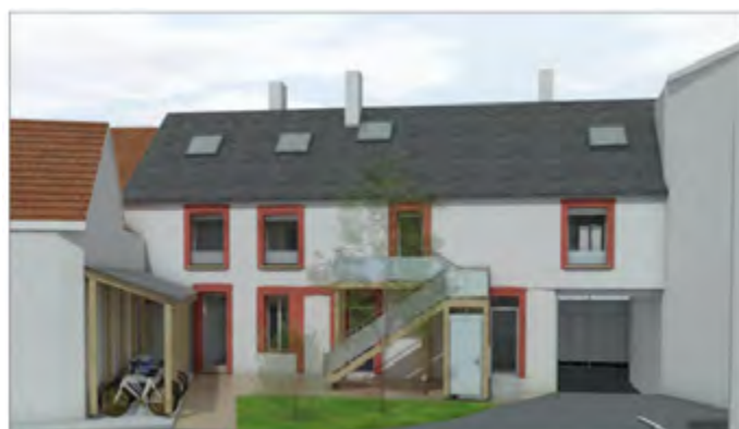
Vue d'architecte, depuis l'intérieur du terrain

Le projet de réhabilitation du 24 Grande rue avance. La commune gère en direct la construction d'un parking de 15 places environ, dont plusieurs seront réservées aux résidents de cet immeuble. Pour cela il a fallu abattre la grange en travers du terrain. Le fond de la parcelle est maintenant ouvert.