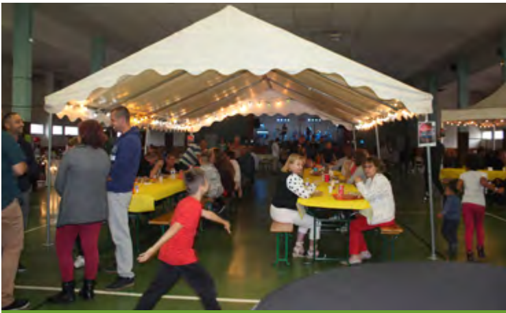
Fête de la musique / 18 juin