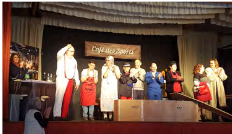
Théâtre / 26 mars