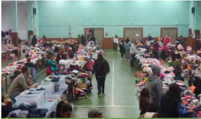
Bourses aux jouets / 6 Novembre