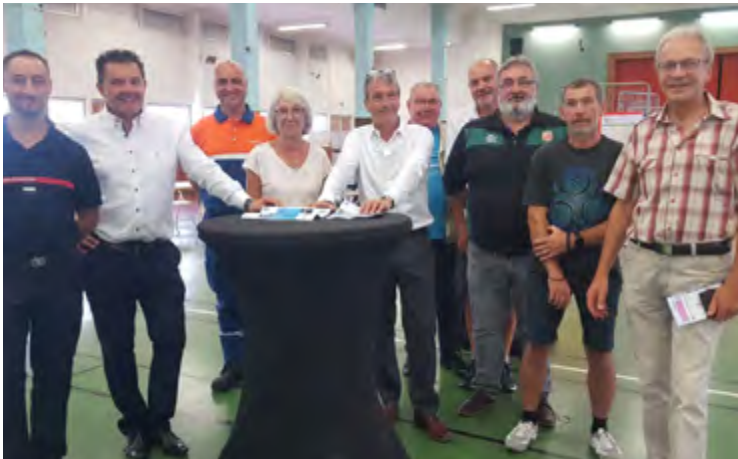
Forum des associations / 4 Septembre