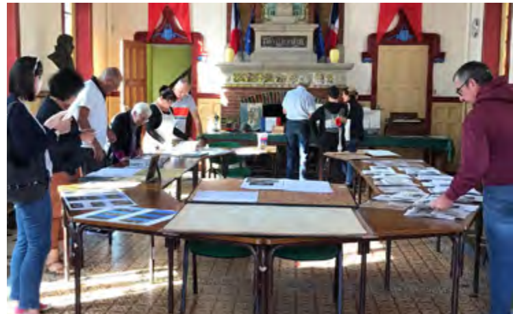
Journée du patrimoine / 17 Septembre