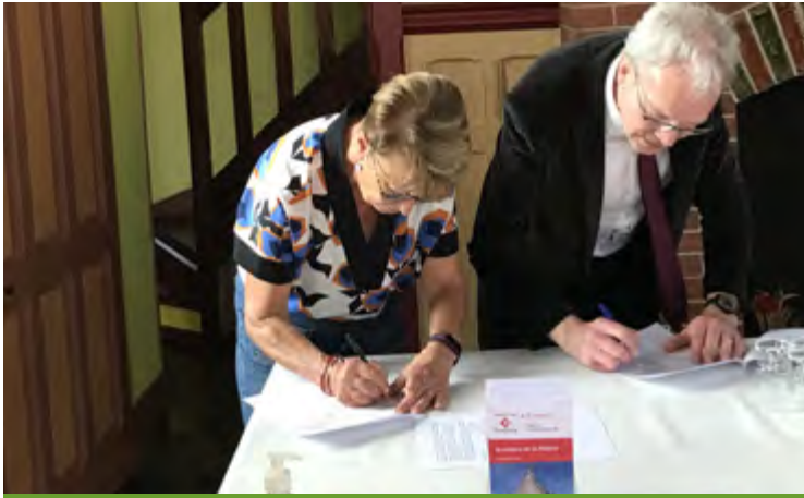
Convention avec la Fondation du patrimoine / 6 mai