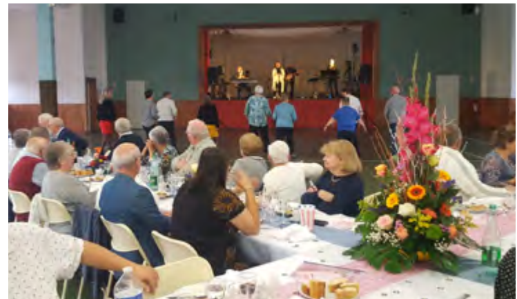
Repas aux Séniors / 23 octobre