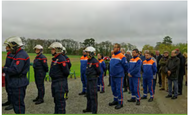
Cérémonie patriotique 11 Novembre