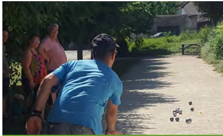
Concours de pétanque / 14 juillet