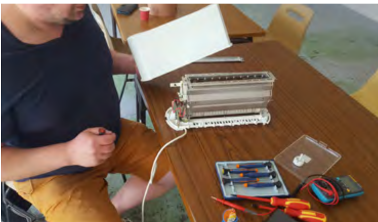
Répar'Café / 17 Septembre