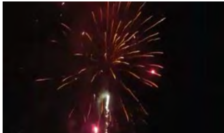
Feu d'artifice du Noël des enfants / 11 décembre