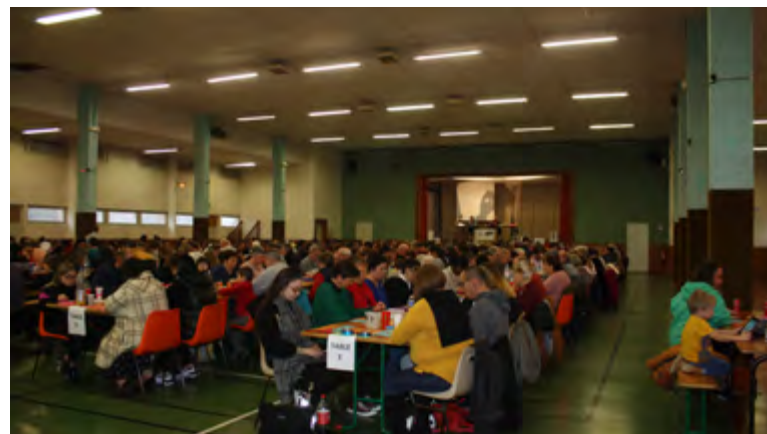
Loto de la St Valentin / 12 Février