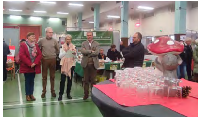
Foire Expo / 20 novembre