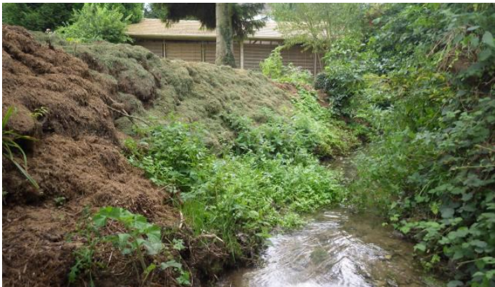
Dépôt d'herbe coupée sur une berge de l'Ocre

L'état des lieux de la Voise a notamment mis en évidence de nombreux désordres. Certains particuliers déposent leurs déchets (herbes, branches...) sur les berges ou dans le cours d'eau. La rivière n'est pas une poubelle et le SMVA rappelle que ces pratiques sont interdites tout comme l'utilisation de produits phytosanitaires dans ou à proximité des cours d'eau.