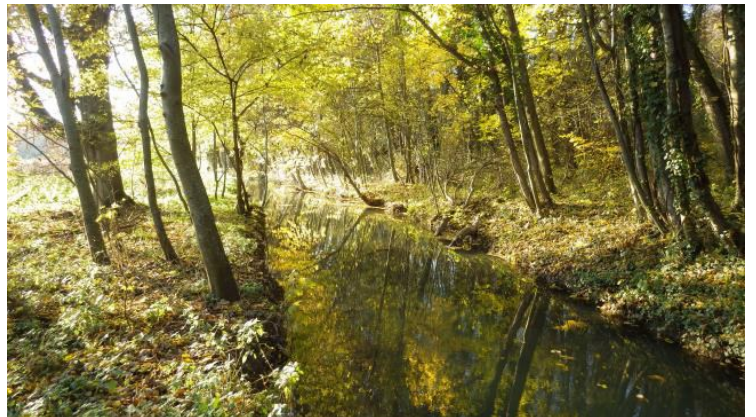
Végétation à l'automne sur la Rémarde