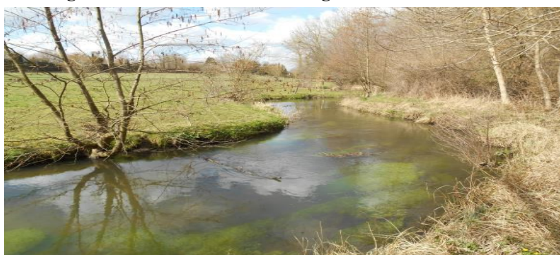
La Voise en hiver.