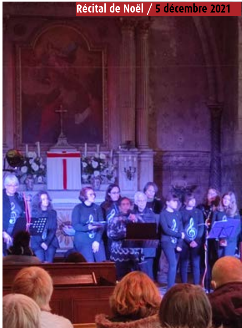
Récital de Noël / 5 décembre 2021