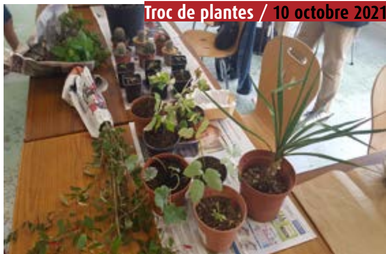
Troc de plantes / 10 octobre 2021