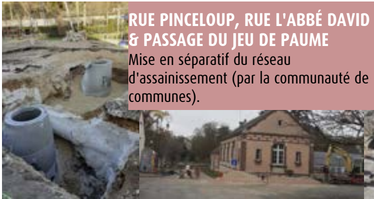
RUE PINCELOUP, RUE L'ABBÉ DAVID & PASSAGE DU JEU DE PAUME Mise en séparatif du réseau d'assainissement (par la communauté de communes).