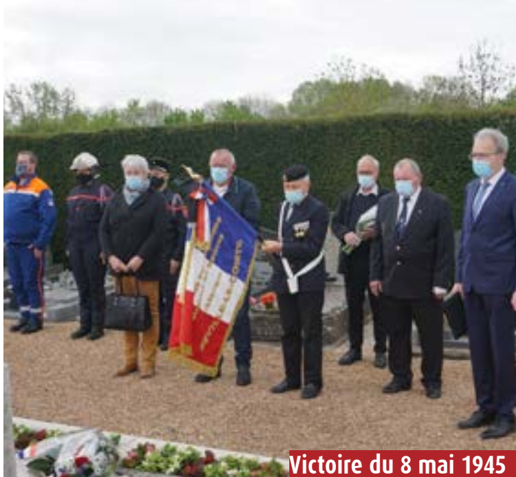
Victoire du 8 mai 1945

La situation sanitaire en 2021 a conduit à l'annulation de nombreuses manifestations prévues. Les associations proposent en effet chaque année plus de 40 évènements. Les commémorations du 8 mai 1945 et du 11 novembre 1918 se sont déroulées dans un format réduit, pour ne pas oublier ces moments qui ont ponctué notre histoire.