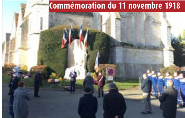
Commémoration du 11 novembre 1918