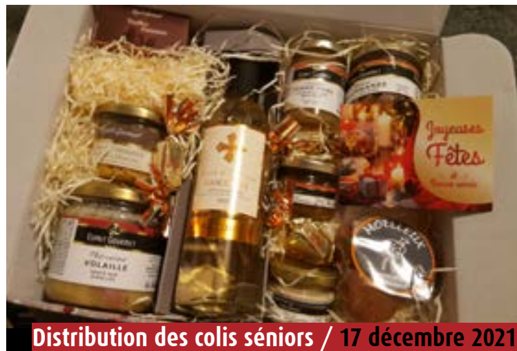
Distribution des colis seniors / 17 décembre 2021