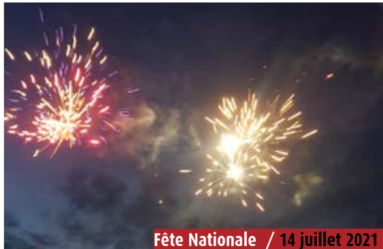
Fête Nationale / 14 juillet 2021