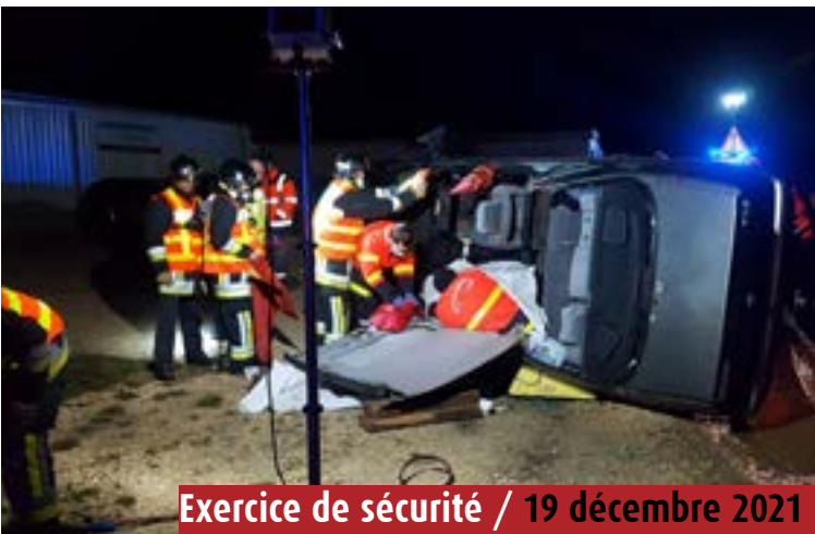
Exercice de sécurité / 19 décembre 2021