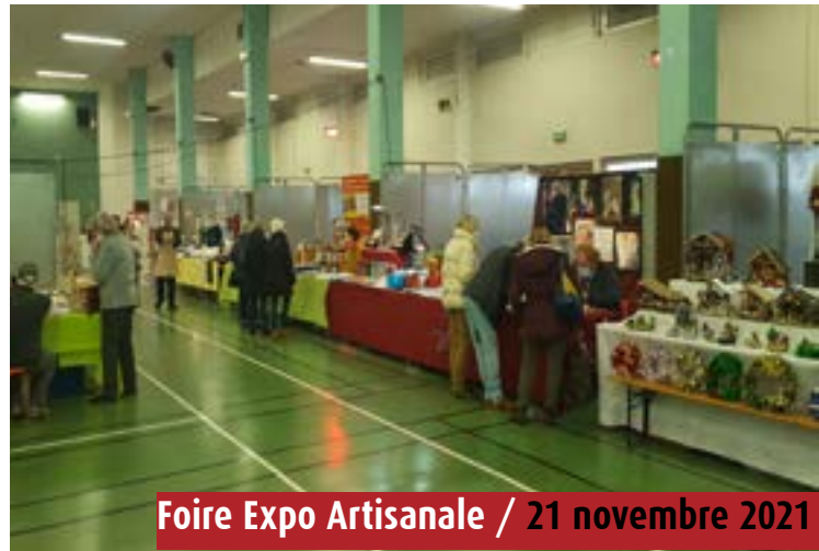
Foire Expo Artisanale / 21 novembre 2021