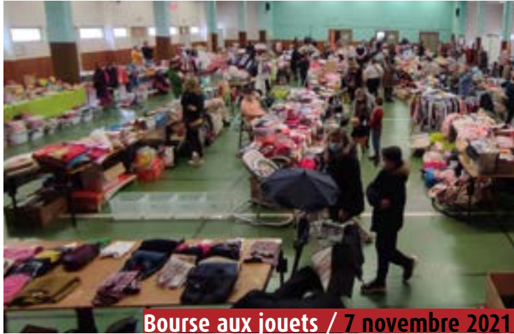
Bourse aux jouets / 7 novembre 2021