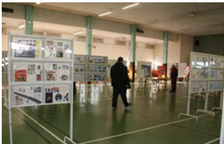
Le Timbre fait son cinéma ! / 25 & 26 sept 2021