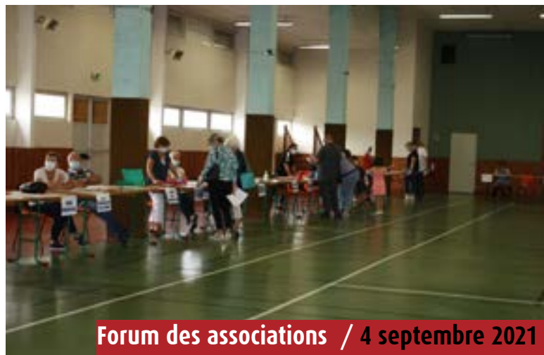
Forum des associations / 4 septembre 2021