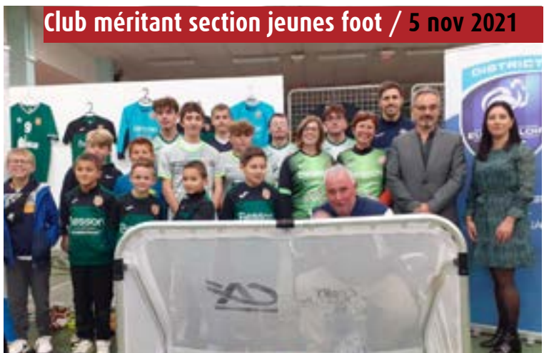
Club méritant section jeunes foot / 5 nov 2021